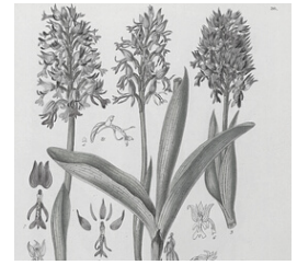
dessin de Vincent Fossat