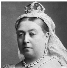
la Reine Victoria

Enfin, Alice / Agathe va rencontrer la Reine Victoria. Dans le roman aussi c'est à elle que Lewis Carroll fit allusion. Elle était réputée pour son autorité. La reine a séjourné à Nice à partir de 1891, et on construit même un hôtel à son nom "Le Régina" à Cimiez en 1895. Dans le roman, elle voudra jouer au croquet avec Alice mais étant mauvaise joueuse, lorsqu'Alice gagne la partie, elle ordonnera fameusement qu'on lui coupe la tête. Ici c'est au jeu de mourra,